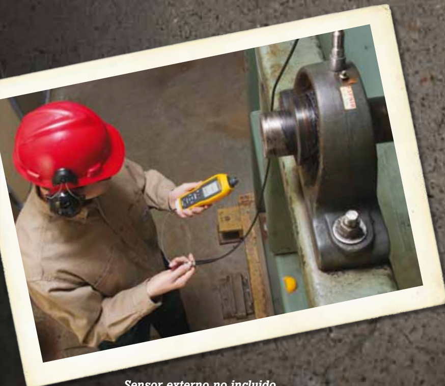
Sensor externo no incluido