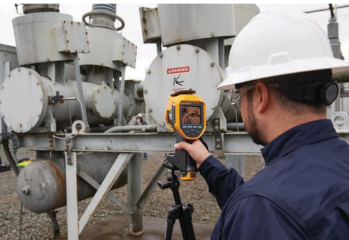
Figura 1. Un inspector utiliza el detector de gas Fluke Ti450 SF6 para inspeccionar conexiones atornilladas.

Los equipos de las subestaciones, como disyuntores y transformadores, conmutan y transforman altas tensiones y corrientes. La conmutación de altas tensiones supone un riesgo para la seguridad y la producción en forma de arcos eléctricos. El gas SF 6 se utiliza para el aislamiento en estos equipos. De hecho, este gas de efecto invernadero es una alternativa más eficaz que otros aislantes, como el aire y el aceite, debido a sus propiedades de ionización como gas de extinción. Sin embargo, al tratarse de un potente gas de efecto invernadero, es importante garantizar su detección y tratamiento adecuado en caso de fuga.