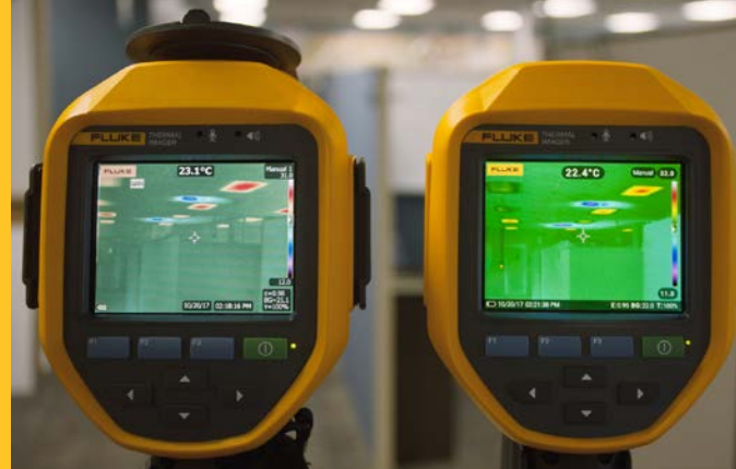
Figura 1. Comparación de pantallas entre los modelos Ti450 y Ti450 PRO

Recientemente se han introducido mejoras en las cámaras termográficas de las series Ti480, Ti450, Ti400 y Ti300 PRO de Fluke para crear la nueva serie PRO (Ti480 PRO, Ti450 PRO, Ti400 PRO y Ti300 PRO). Se trata de instrumentos que permiten a técnicos, ingenieros y electricistas encontrar más fácilmente la causa de cualquier problema mediante la identificación de puntos calientes, puntos fríos y diferencias aparentes de la temperatura de la superficie con mayor fiabilidad. A continuación encontrará cinco funciones mejoradas de las cámaras termográficas de la serie profesional de Fluke que ayudarán a su equipo a resolver problemas con rapidez.