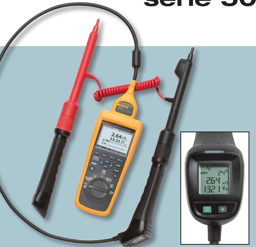
Sonda de teste inteligente com visor LCD integrado

A complexidade de testes reduzida, o fluxo de trabalho simplificado e a interface do usuário intuitiva fornecem um novo nível de facilidade de uso em testes de baterias.