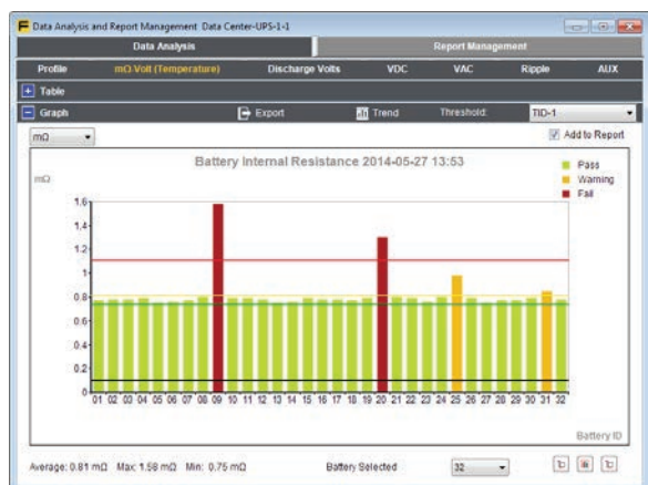
Histograma de uma cadeia de baterias com limites definidos pelo usuário.