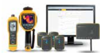
Cámara termográfica Fluke Ti450, Medidor de vibraciones Fluke 805 FC, Control de estado deFluke