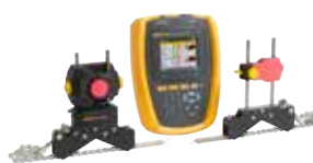
Alineador láser de ejes Fluke 830