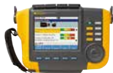
Medidor de vibraciones Fluke 810