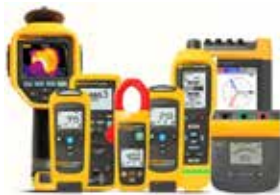
Térmico, eléctrico y mecánico