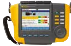
Analizador de vibraciones