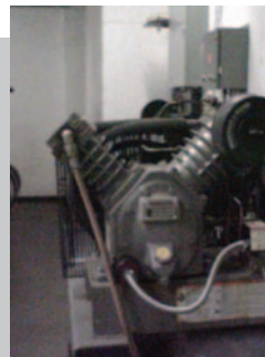
Hava Kompresörü – Tam Görünür

Olası sorunları tespit etmeye yardımcı olan, önemli ayrıntılar sunan, hassas şekilde karıştırılmış görsel materyaller ve kızılötesi görüntüler.