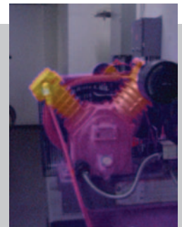
Hava Kompresörü – AutoBlend™ Modu