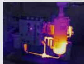
Fusion à 75 %