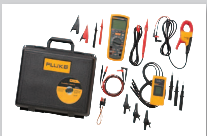
MDT avanceret fejlfindingssæt til motor og drev