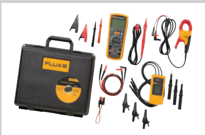
MDT Advanced: feilsøkingspakke for motor og drivverk