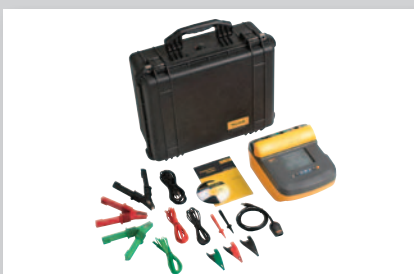
Fluke 1550C pakke for testing av isolasjonsmotstand