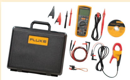
Fluke 1587 FC ET avansert pakke for elektrisk feilsøking