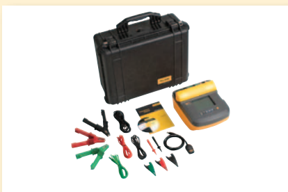
Fluke 1555 pakke for testing av isolasjonsmotstand