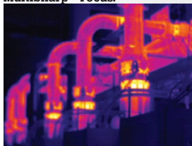
Ręczna regulacja ostrości

100% ostrości – każdy obiekt. Z bliska i z daleka. Technologia MultiSharp™ Focus.