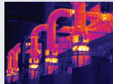
Система фокусировки MultiSharp