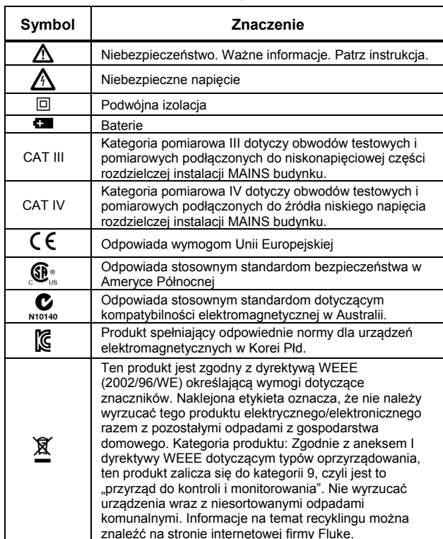
Tabela 1. Symbole