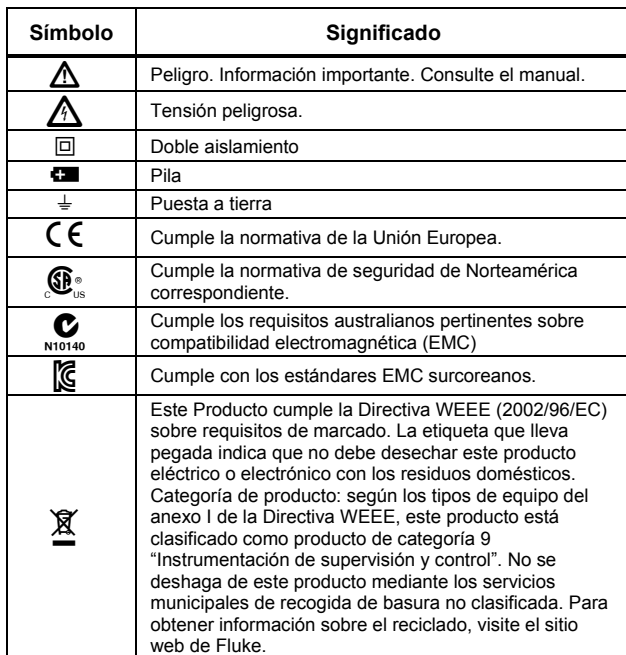
Tabla 1. Símbolos